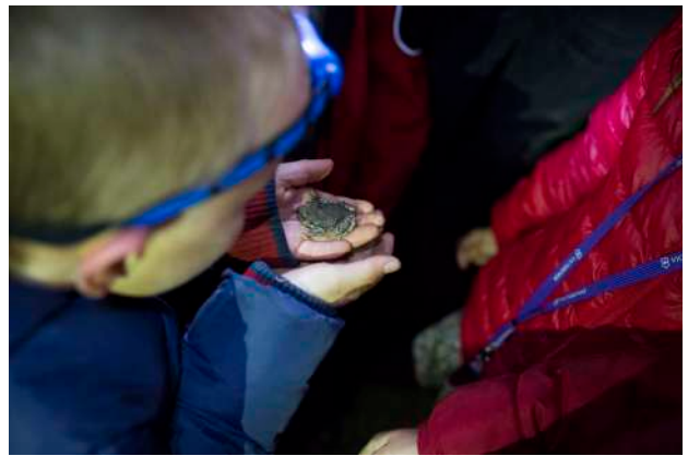
4. © Yann André