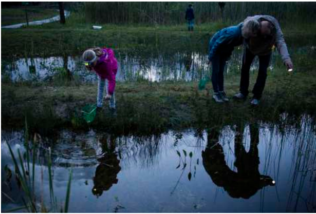
1. © Yann André