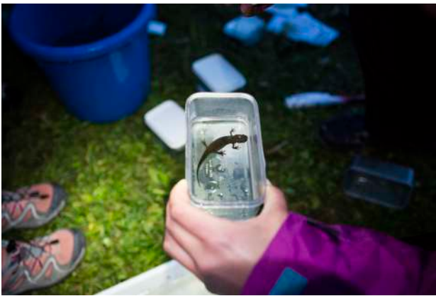
3. © Yann André