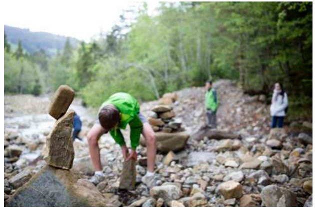
2. © Yann André