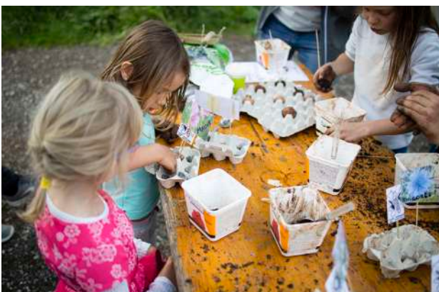
7. © Yann André