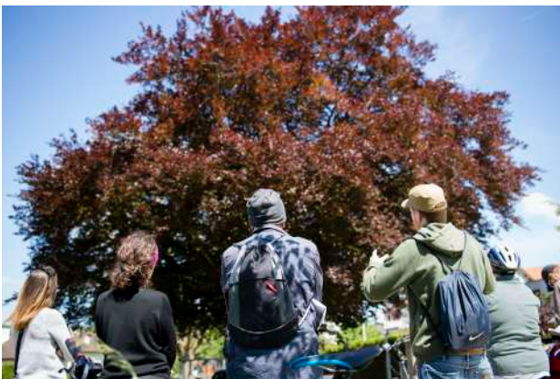
5. © Yann André