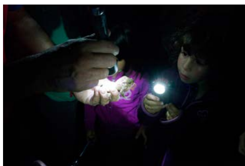
8. Fête de la Nature