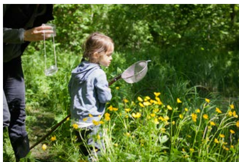
6. Fête de la Nature