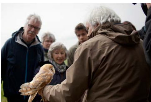
7. Fête de la Nature, ©Yann André