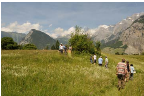
1. Fête de la Nature