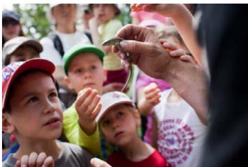
3. Fête de la Nature, ©Yann André