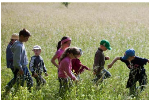
5. Fête de la Nature