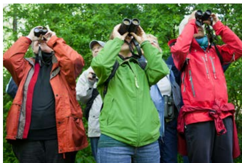
4. Fête de la Nature, ©Yann André