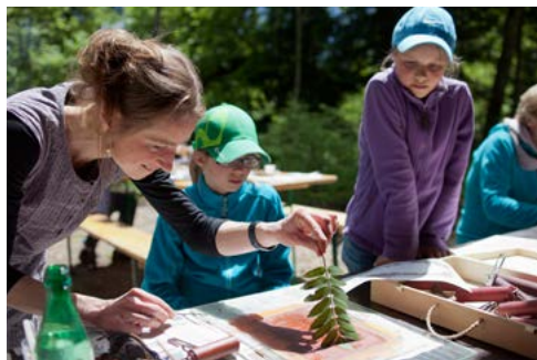
2. Fête de la Nature